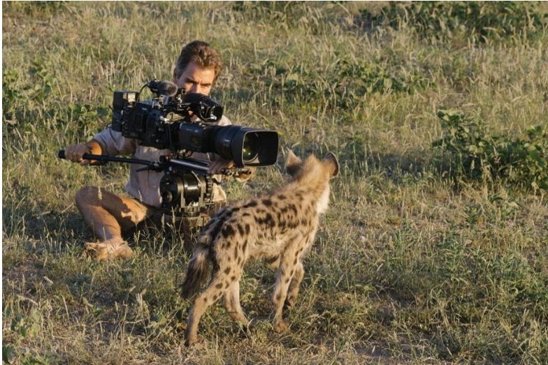
کیم وُلتر؛ تصویربردار حیات وحش

نکته جالب اینجاست که ما همیشه توصیه می‌کنیم که با دوربین‌های هندی‌کم کار را شروع کنید. البته منظورمان این نیست که فیلم‌نهایی خود را با هندی‌کم بسازید. بلکه تا زمانی که مهارت کافی در نزدیک شدن به سوژه را پیدا کنید، به سراغ دوربین‌های حرفه‌ای نروید.